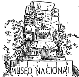
2. El Museo Nacional de Antropología